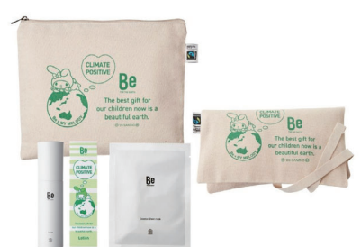
Be × マイメロディ ホリデーコフレ限定セット (Be ローション)

濃密泡で肌を包み込み洗い上がりもつっぱらない泡洗顔「Beフォームウォッシング」とマイメロディの限定タオルハンカチ、Beエッセンスシートマスクのセット。 今治で作られたタオルハンカチ、フェアトレードオーガニックコットンのポーチとサステナブルなアイテムを凝縮しました。