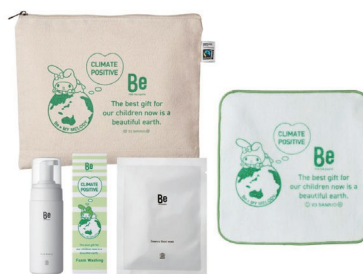
Be × マイメロディ ホリデーコフレ限定セット (Be フォームウォッシング)

メイク落ちと、うるおいの両方を叶える「欲張りクレンジングオイル」とマイメロディの限定エコバッグ、Beエッセンスシートマスクのセット。 ペットボトルから作られた再生ポリエステルを使用した環境に配慮したエコバッグ、そしてフェアトレードオーガニックコットンのポーチとサステナブルなアイテムを凝縮しました。