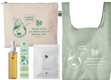
Be × マイメロディ ホリデーコフレ限定セット (Be クレンジングオイル)

メイク落ちと、うるおいの両方を叶える「欲張りクレンジングオイル」とマイメロディの限定エコバッグ、Beエッセンスシートマスクのセット。 ペットボトルから作られた再生ポリエステルを使用した環境に配慮したエコバッグ、そしてフェアトレードオーガニックコットンのポーチとサステナブルなアイテムを凝縮しました。